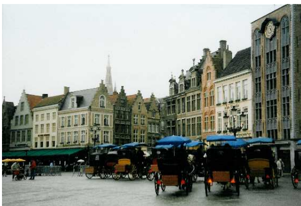
Bruges au mois de mai