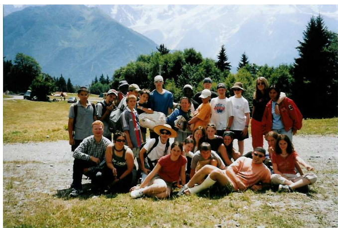
Campeurs et moniteurs dans les Alpes françaises